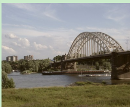
..... Verbinding tussen cliënt en directie .....

Medezeggenschap vanuit cliëntperspectief