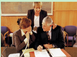
..... De juiste vragen stellen .....

Medezeggenschap vanuit cliëntperspectief